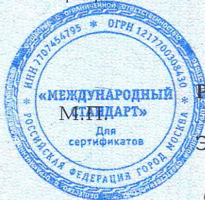
Схема сертификации: 1с.